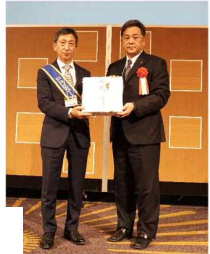
「記念品交換」 熊本東南RCから「肥後象眼額絵」 和歌山東南RCより「紀州漆器額漆画」