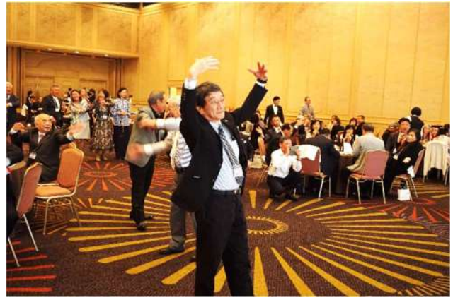
「和歌山東南RC 赤在依美会員」 「瑠璃色の地球」歌唱&和歌山東南RC皆様応援