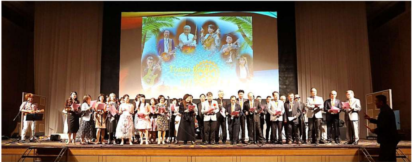
「台湾 板橋南區RCの皆様」