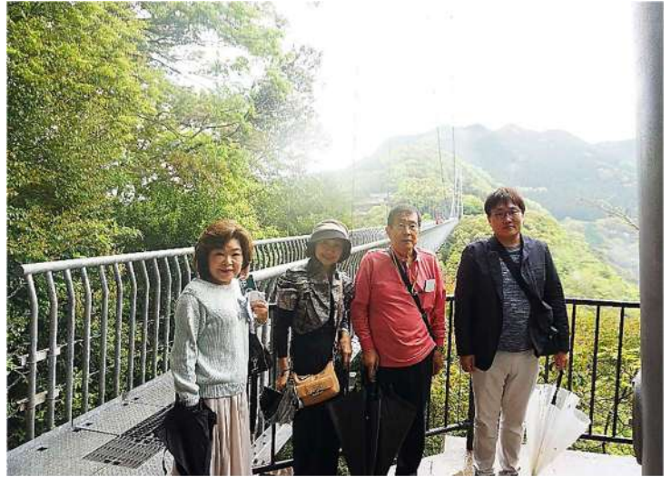
渡りきった皆様と (お先に渡った方もおられるかも…ですが)