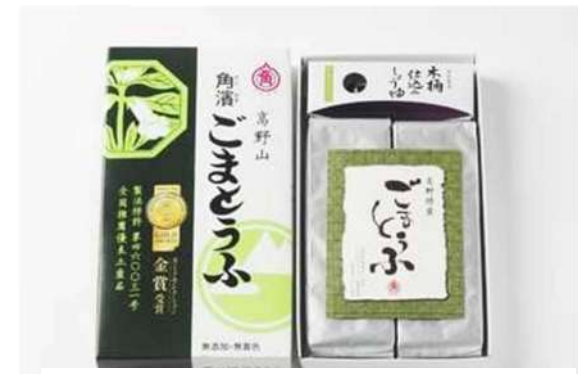
お土産「熊本東南RC全会員の皆様へ」 和歌山東南RC 塩崎会長より 高野山 角濱 ごまとうふ