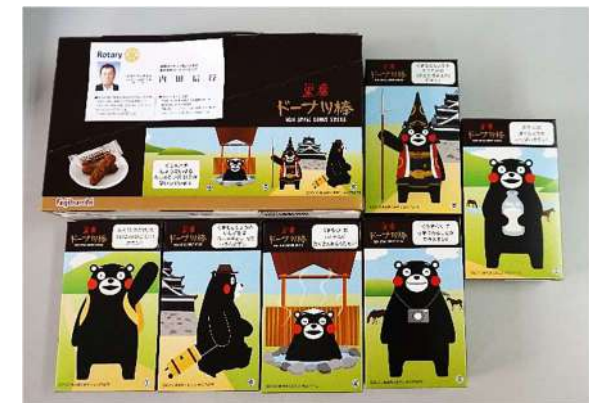
お土産「熊本東南RC 内田 40周年実行委員長より」