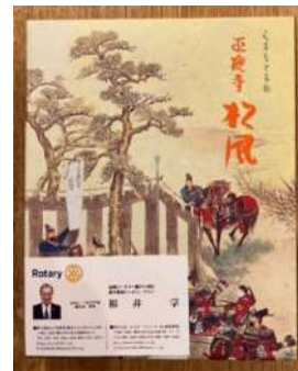
お土産「熊本東南RC 福井姉妹クラブ委員長 より」