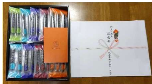
「記念品」 熊本東南RCより