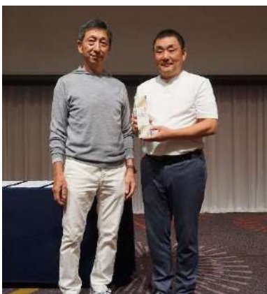
「古庄賞」熊本東南RCより 肥後象眼ペーパーナイフ