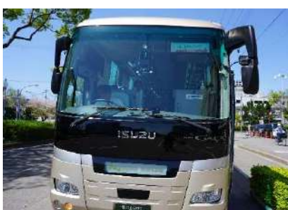
「JR 和歌山駅 11:00 出発」