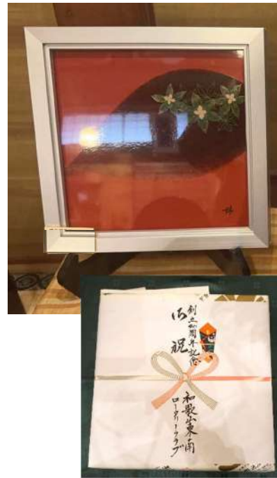
「クラブ間記念品」和歌山東南RCから 漆工芸家橋爪康雄作 紀州漆器 額漆画「ゴゼンタチバナ」