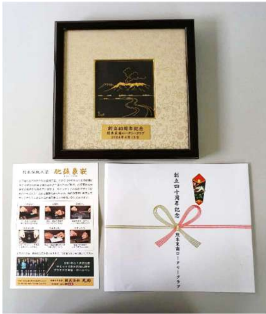
「クラブ間記念品」熊本東南RCから 肥後象眼 額絵「阿蘇の景色」