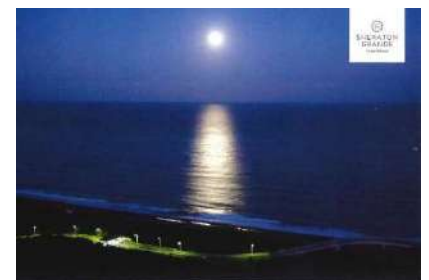
「観光組 ホテル前にて」