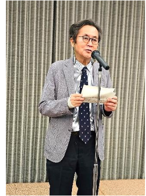
司会進行 ホストクラブ 中RC 戎幹事