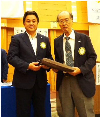
中 弘 会 員