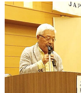
吉田クラフツ奉仕委員長 会員増強委員長