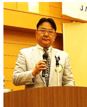
土屋青少年奉仕委員長