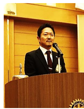
「新会員より一言」挨拶