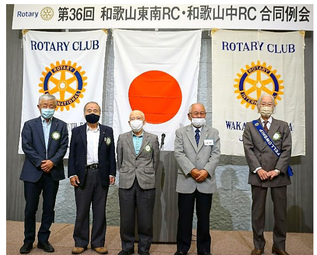
「和歌山中RC 創立時(1985年) 在籍会員ご紹介」 中RC5名、東南RC5名