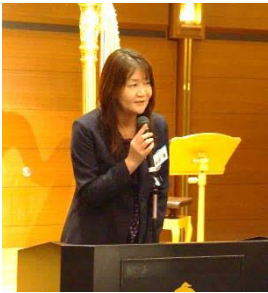
東南 RC 松浦幹事