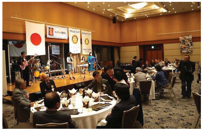
《アトラクション》 フロシード(BGM演奏60分)