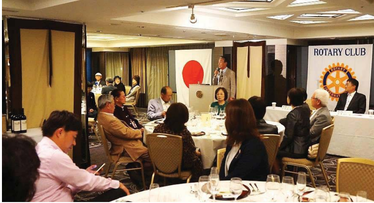
乾杯の挨拶 釜中会員