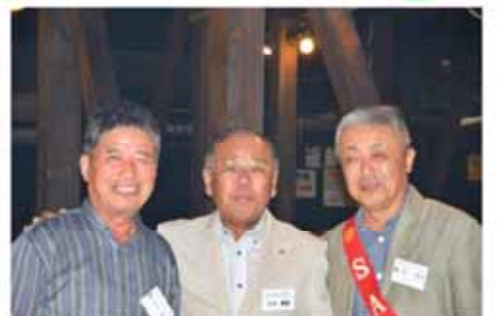
溝落会長より優勝者へ賞品贈呈