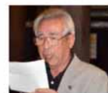
中RC 市川出席委員長