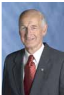
ウィリアム B. ボイド 2006-07年度、国際ロータリー会長

9月は『新世代の為の月間』 (Every Potarian an Example Youth)