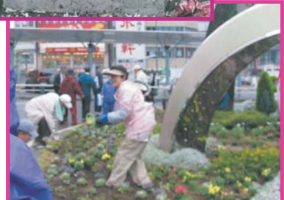
大橋市長参加 皆様、雨の中ご苦労様とご挨拶がありました