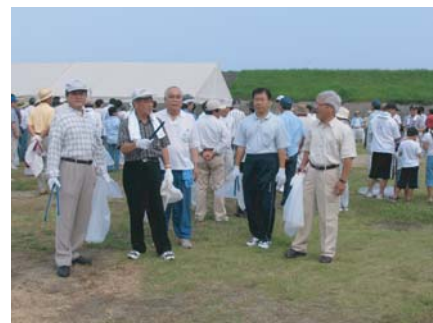
河川愛護月間行事でロータリークラブの会員も参加しました。ご参加の皆様お疲れさまでした。