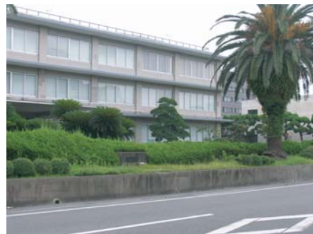
和歌山地方裁判所

成人女性をワイセツ目的で民家に侵入ワイセツ行為をし脅迫した。このような事件の公判を傍聴した。