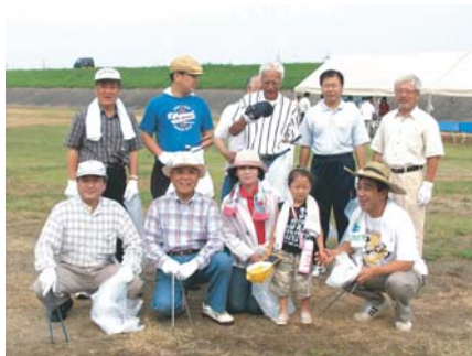
当日参加したメンバーの一部 他 数人の参加がありました