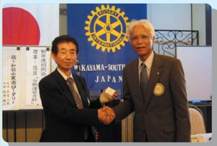
新旧会長バッジ交換