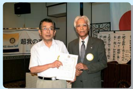
ガバナー補佐委嘱状授与