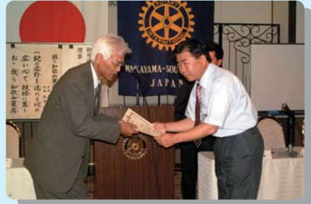
地区IT委員長委嘱状授与