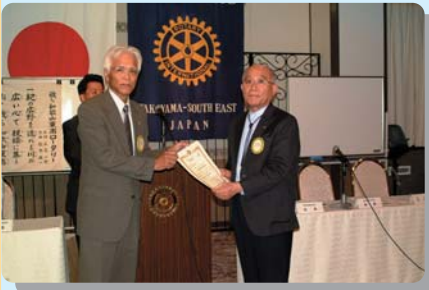
地区米山委員長委嘱状授与