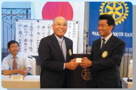
新旧幹事バッジ交換