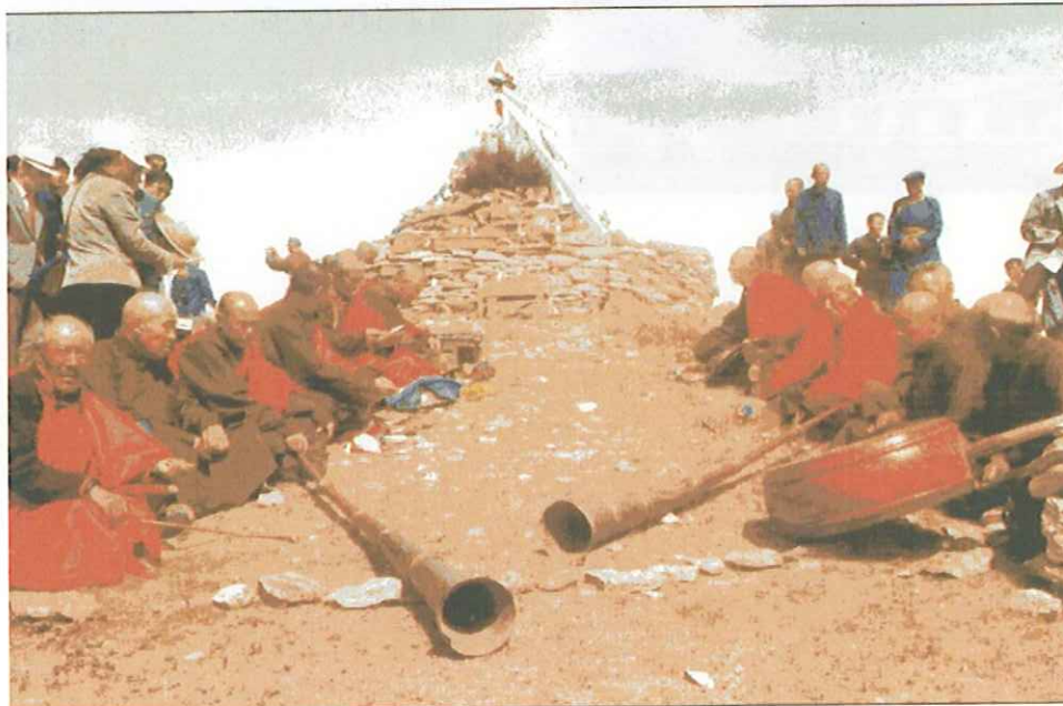
モンゴルの伝統的な祭りー仏教のラマ教のオーボー祭り