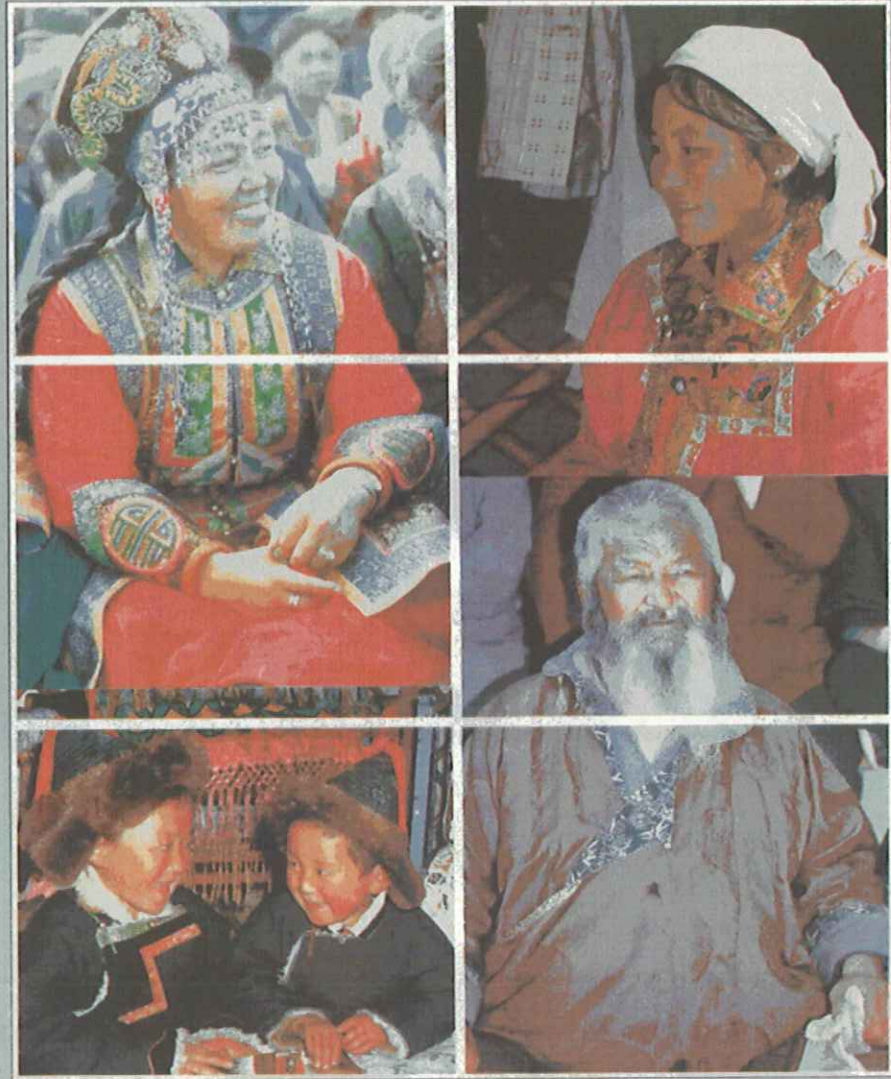
モンゴル服——デール